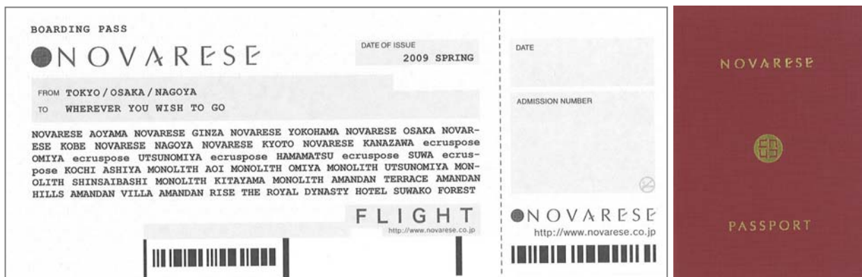
左) 航空チケット風にデザインした会社説明会への入場チケット 右) 面談で渡す専用パスポート

当社社員も都度コメントを記載し、双方の記録が、実際の旅行での滞在許可の判子のような役割を果たします。