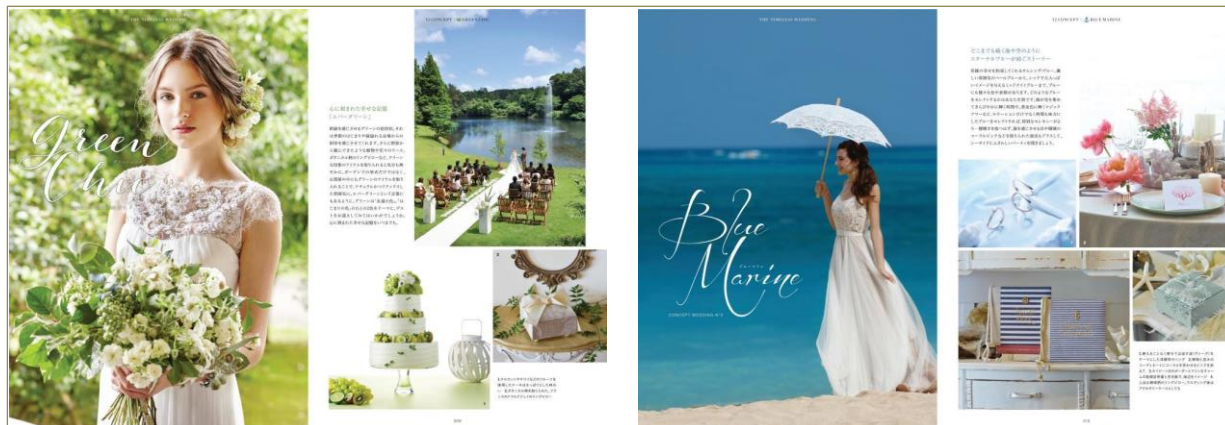
12通りのデザインカテゴリに整理して婚礼アイテム全般を紹介する第一章。左はコンセプト「GREEN CHIC」のページから、右のコンセプトは「BLUE MARINE」。色や雰囲気など、それぞれで統一した世界観で紹介