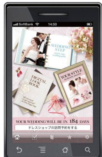
「ドレスショップの訪問予約をする」等を表示するリマインダー機能や「184DAYS」などカウントダウン機能も搭載