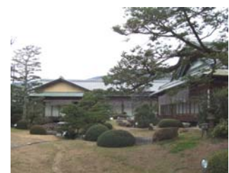
三瀧荘の現在の外観

料亭旅館「三瀧荘」は、2800㎡の広大な敷地に、延べ約2000㎡の木造2階建ての建造物が立つ、日本庭園も備える昭和初期の和洋折衷の豪邸です。原爆による焼失を免れ、1946年に料亭旅館