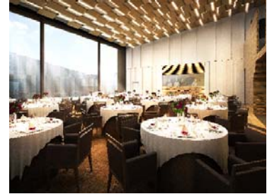
メインダイニングイメージ

また、メインダイニングの扉を開けた瞬間、一面に広がる天井高いっぱいには設けられたガラス窓から光と緑を感じることができ、開放感溢れる空間となっています。メインダイニングには2階から大階段を設置しており、新郎新婦が列席者の頭上から降り立つドラマチックな入場を行うことが可能です。