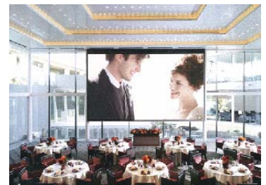
ダイニングイメージ

披露宴会場には、挙式シーンや思い出の写真などが映し出ることができる300インチ（約6.1m×4.6m）の巨大なスクリーンを設置します。当社には『オープニング』『プロフィール』『エンドロール』の映像を映画仕立てで作成するオプションプランもあり、シアター級の大迫力画面で、会場の招待客によりドラマチックで感動的な演出をプロデュースできます。