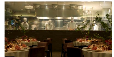
オープンキッチンイメージ

厨房は、作り手の臨場感がお楽しみいただけるオープンキッチンを採用します。従って、調理した料理をすぐに参列者にサーブすることができ、料理でも競合他社とクオリティの差別化を図ります。