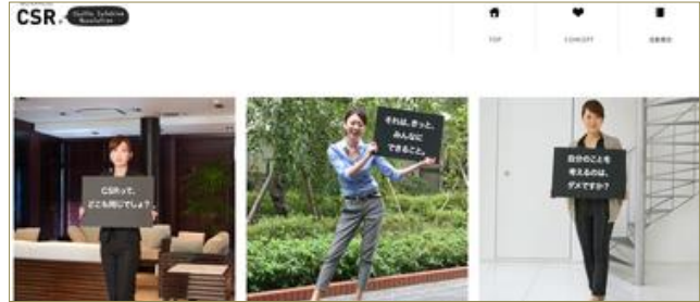
CSR 活動前の印象を記載したボードを持つ社員。写真にマウスポインターを置くと活動後の印象にかわる

活動前には「CSR＝企業の社会的責任」を体感できてないため、活動の意義に漠然とした疑問を示す社員もいましたが、実際の体験で「当たり前のことを当たり前で感謝することの大切さを再認識できた」と、意識の変化が現れました。