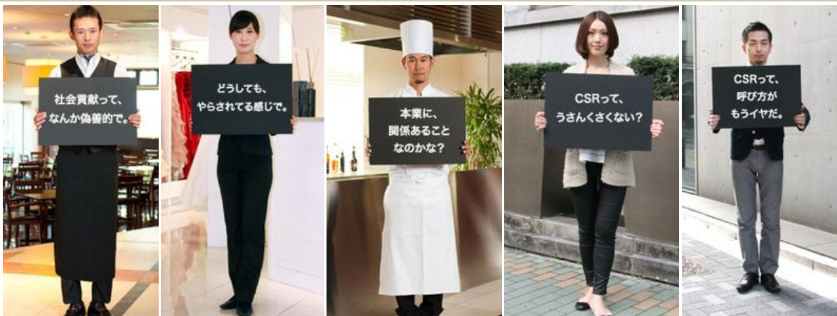
上)活動前の CSR のイメージ 下)活動後の CSR の印象

今回の CSR サイトの立ち上げに際し「こうした活動前後のギャップは当社だけではないのでは？」という意見から、より多くの方に CSR の重要性を知っていただければ、との想いを込めたサイトづくりを行いました。