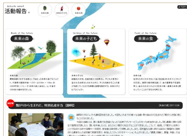
ビジュアルを重視した可愛く見やすいトップ画面

特に、農業研修等を行う「未来の食」プロジェクトは、実地研修を受け入れた農家の作物を加工食品として販売するまでを支援しており、県が進める地域活性化運動に認定されるなど、都道府県ほか農林水産省が支援する6次産業化事業の実行組織や、農家、大学などから評価されています。