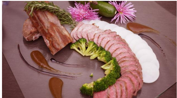
ローストビーフ村上市の大根の和風ソース