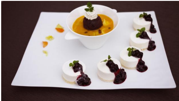
こめんぼうのフルーツぜんざい

それら16種類の食べ放題を、税込2500円(子ども1000円、三歳以下無料)とリーズナブルな価格で提供し、時間無制限(11:00~15:00)でお楽しみいただけます。