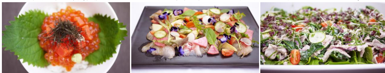
村上の塩引き鮭といくらの醤油漬げごはん、岩船産真鯛と赤かぶのマリネ、村上産あじわいポークのしゃぶしゃぶとほうれん草の塩麴和えサラダ

このように協力関係を構築するなか、農家の方から「地元食材の新たな可能性を引き出しPRしたい」との相談を受け、食材調達で同 NPO 法人の助言を受けながら本企画を実施する運びとなりました。