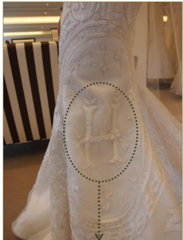
優美にデザインされたHの文字が卓越した刺繍技術で立体的に。“あなたのために”文字そのものもデザイン

応募方法など詳しくは、下記同社運営のウェブサイト「ザ・ウエディング」でご覧いただけます。 http://www.the-wedding.jp/member/present/novarese_pr131112