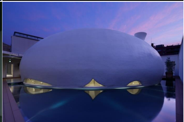
近代美術館のような外観(左上:アマンダンテラス、右上:アマンダンヴィラ)と内観(左下:北山モノリス)。近未来的な球形デザインのチャペル(右下:天神モノリス)