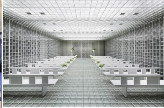
正面玄関が国の重要文化財の「旧桜宮公会堂」(上段)。外観はそのままに1階を当時の様式美を活かした披露宴会場(下左)に改装しながら、2階にガラスで囲まれた近代的なチャペル(下右)をつくりました。