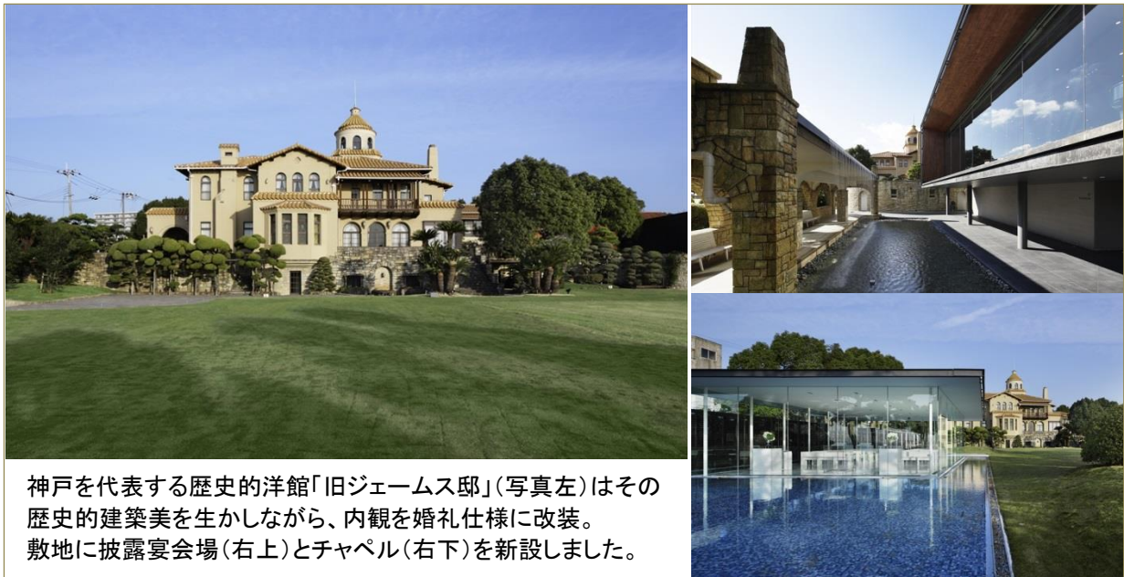
神戸を代表する歴史的洋館「旧ジェームス邸」(写真左)はその歴史的建築美を生かしながら、内観を婚礼仕様に改装。敷地に披露宴会場(右上)とチャペル(右下)を新設しました。

これからも当社の視座の先にある、機能的なアイデアと建築的な美しさの双方を兼ね備えた、婚礼施設を超えた建築物を、つくりつづけていきたいと考えています。