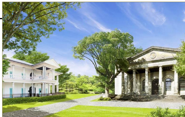
右が旧桜宮公会堂。左の泉布観と隣合せ

「旧桜宮公会堂」の建物は当社が2013年4月から、フレンチレストラン兼婚礼施設として改装し、運用している、大阪を代表する歴史的洋館です。ローマ神殿風の重厚な石造りが特徴の正面玄関は、国の重要文化財に指定されています。約6000平米の広大な敷地内には、建物自体が国の重要文化財に指定されている「泉布観」も現存します。