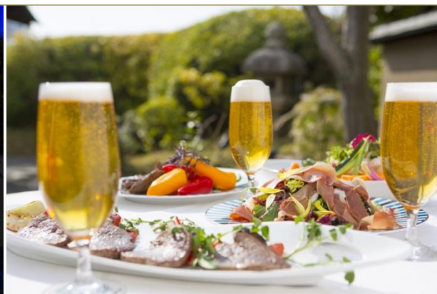
ライトアップした国の重要文化財を眺めながら優雅な“大人ビアガーデン”を… (右はイメージ写真)