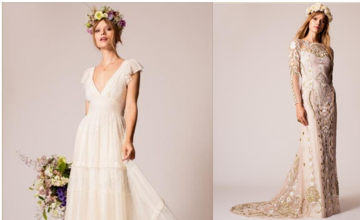
ともに「ボヘミアン」スタイル(テンパリー・ロンドン)、なかでもVネック(左)はバイヤーのイチオシの一着