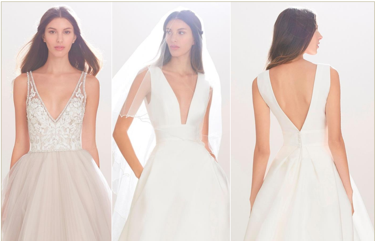
キャロリーナ・ヘレラの新作ドレス。右と中の写真は同じドレス、前後でVゾーンを強調

その他、今年から注目を集めている「透明感のあるドレス」や、昨年から引き続き人気の「ボヘミアン」スタイルも健在です。なかでも「ボヘミアン」テイストでかつVネックデザインのドレスは、当社バイヤーがイチオシするドレスです。