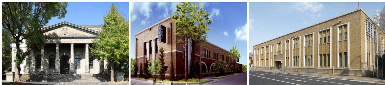
歴史的洋館でのキャンドルナイトは格別、左から「旧桜宮公会堂」「芦屋モリス」「姫路モリス」