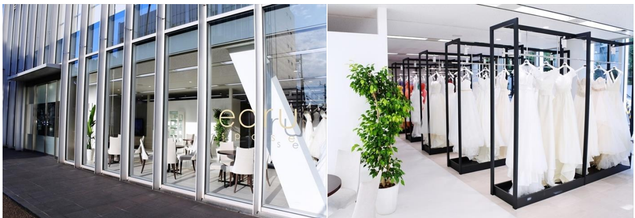
「エクリュスポーゼ高松店」の外観(左)、内観(右)

店舗で取り扱う衣裳の9割がオリジナル商品で、当店にしかない特別感のある品ぞろえで、他社との差別化を図ります。