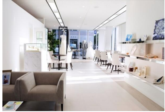
小物も充実させる

ゼクシィの結婚トレンド調査 2016 によると、香川県の新婦が結婚式でかける衣裳の総額は 50.4 万円と全国平均(47.4 万円)を 3 万円も上回り、加えて前年(同調査 2015)より 6 万円もアップしています。ウェディングドレスの好調な香川県のマーケットで、2018 年度(12 月末まで)は新郎新婦約 120 組の利用(レンタル、販売ほか)で、8900 万円の売上高を目指します。婚礼施設が本稼働する 2019 年度は年間約 145 組の利用で、約 1.1 億円まで売上高を伸ばす目標です。