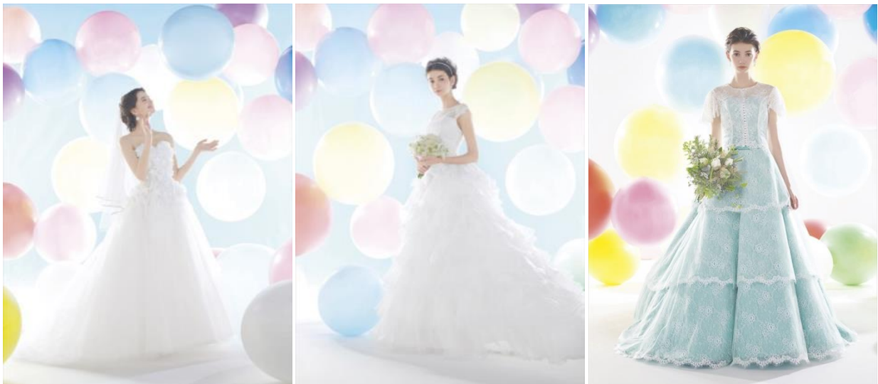
レンタル・販売するウェディングドレス、左から 1,2,6