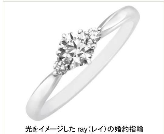
光をイメージしたray(レイ)の婚約指輪

標準価格は婚約指輪が税別193,600円から、新婦用の結婚指輪が同100,100円からです。リング内側には全て、NOVARESEのロゴの刻印が入ります。