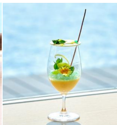
美しいスイーツが食後に華を添えます。「マンゴーとバナナのヌガーグラッセ ジャンジャンブルのグラニテ」(写真左、5000 円のコース内)「モヒートジュレ メロンとライムのマリアージュ ヨーグルトソルベと共に」(写真右、3500 円のコース内)

プール付きの屋外デッキで、BBQも楽しめます。海と一体になったかのようなインフィニティプールを設けたデッキは、海外リゾートホテルのような贅沢な雰囲気です。焼き台など準備一式を完備しているため、手ぶらでご利用いただけます。実施組数も限定で、昼は4組、夜は2組の、プライベート感あふれるBBQをお楽しみいただけます。