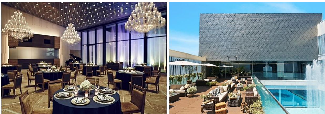
左)【新潟】「新潟モリス」、右)【福岡】「天神モリス」

主要駅近くの利便性の高さと、近代美術館のようなゴージャスかつスタイリッシュな空間が特長の 2 会場(「新潟モリス」(新潟)と「天神モリス」(福岡))では、いつもよりリッチなビアタイムをお楽しみいただけます。