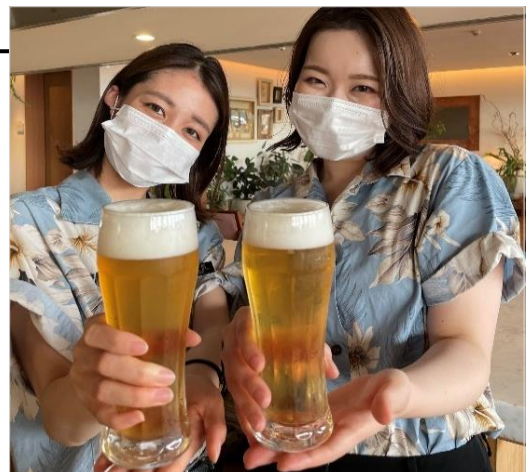
スタッフのマスク着用や ソーシャルディスタンスを意識したレイアウトなど、感染症対策を講じたうえで営業

今年のコンセプトは、“キープスマイリング”です。コロナ禍による外出自粛制限の疲れを癒していたきながら、「多くの人に笑顔になってほしい」という想いを込めて開催します。訪れた瞬間に思わず笑顔になってもらえるよう、スタッフが心を込めておもてなしをします。