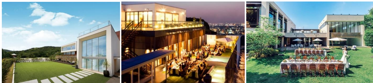
左から)【長野】「アマンダンスカイ」、【名古屋】「アマンダンテラス」、【浜松】「アマンダンライズ」

自然環境の良い立地が特徴の 3 会場(「アマンダンスカイ」(長野)、「アマンダンテラス」(名古屋)、「アマンダンライズ」(浜松)では、森林に囲まれた自然美や、市街地の高台から見下ろす街の夜景など、非日常的な雰囲気の中、優雅なひと時をお過ごしいたできます。