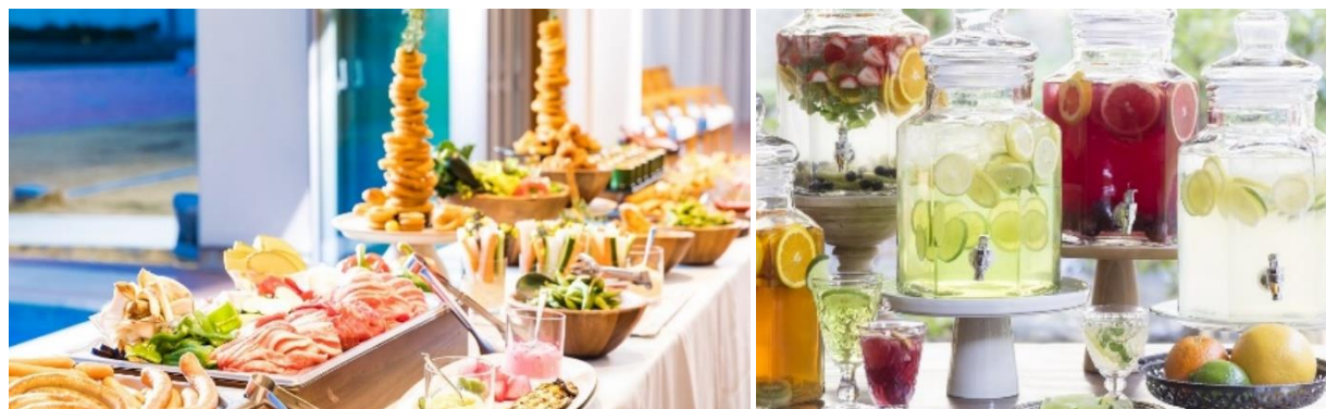
盛りつけ飾り付けもオシャレなビュッフェ台(左)、ドリンクは約 40 種を用意(右) ※写真はイメージ

ドリンクの飲み放題も付けます。生ビールやハイボール、レモンサワー、ワインなどをはじめ、カクテルメニューも用意します。ノンアルコールドリンクも提供するので、“ノンアル派”の方にもオススメです。