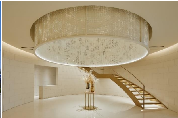
シンプル・モダンな外観、中に入るとリンドウをモチーフにした大型の照明が出迎える