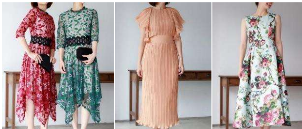
人気デザインの総レースのドレス。秋冬らしいボルドーやモスグリーンを新入荷。デートや旅行などに最適(左) 大人の女性にぴったり、上品なパールカラーのドレス。ゆったりとしたドルマンスリーブで、気になる体型をカバー(中央) インポートドレスらしい、華やかな花柄が特長。Aラインなので1枚でスタイリッシュなコーディネートに(右)

30着はいずれもハイセンスなラインアップで、結婚式のお呼ばれ服としてはもちろん、高級レストランでのデートや女子会など、“特別な日のおでかけ着”に最適です