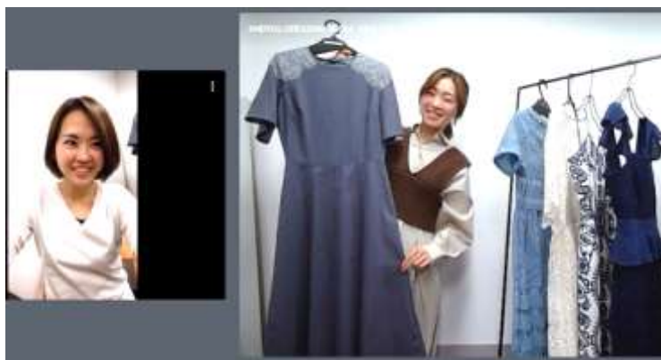
スタッフが実際に着用してサイズ感や素材感を伝えるので、レンタルに不安な方も安心！

利用者の悩みを聞きながら、必要に応じてスタッフが実際にドレスを着用したり、画面上に映すなどしながら、サイズ感や素材感を伝え、気になる点を一つずつクリアにします。