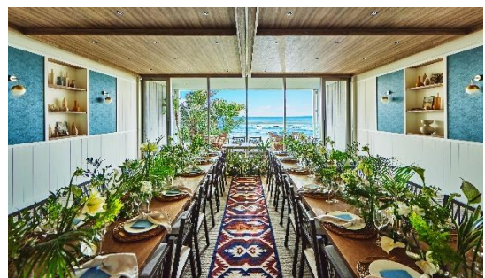
窓の外に広がるオーシャンビューを眺めながら 室内でラグジュアリーなBBQを

また、個室プラン限定で宮崎牛のヒレ肉(+税込10,000円)も提供します。より宮崎らしさを味わえる贅沢なオプションです。