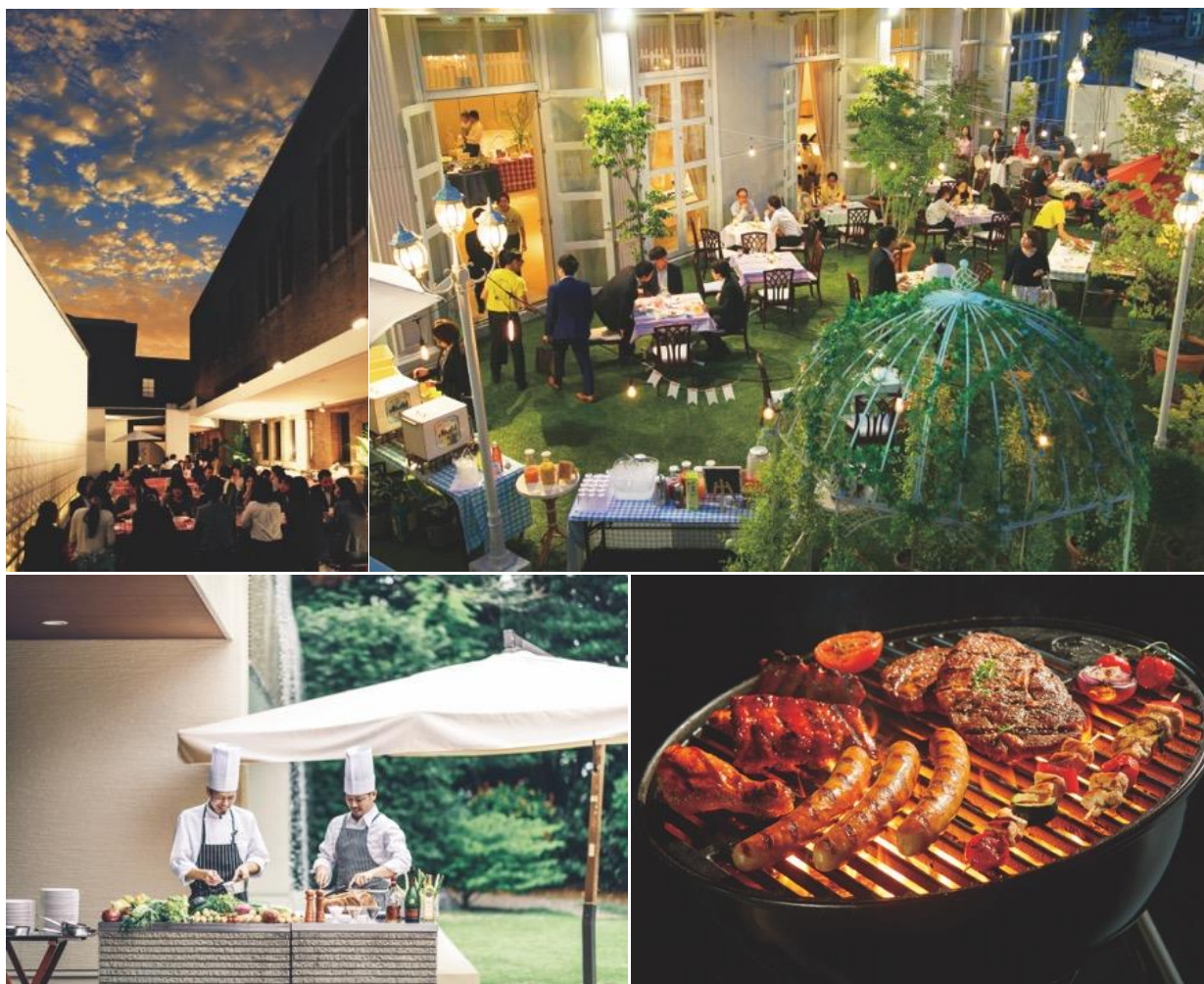
上左)旧通信省別館の歴史的洋館「姫路モノリス」のビアガーデン 上右)青森の「フレアージュスイート」 下)BBQのイメージ