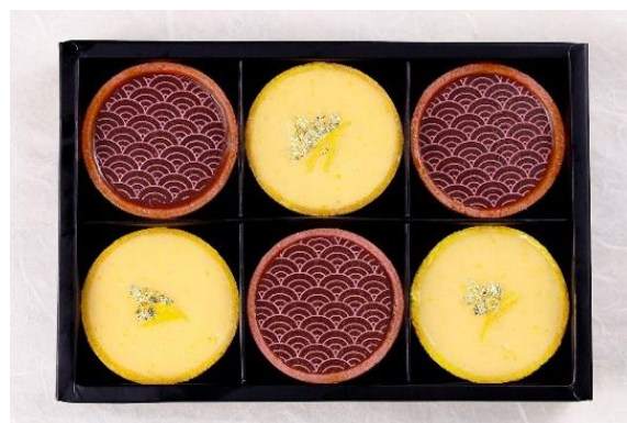
大人の味～自分への“ご褒美チョコ”にもおすすめ～