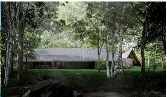
左) 宮古島市のリゾートホテル「ホテル シギラミラージュ」 右) 軽井沢に開業する結婚式場イメージ