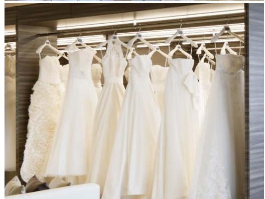
「ロイヤルカイルハワイ マリオットサロン」