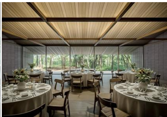
軽井沢に開業する結婚式場イメージ / 左)チャペル 右)バンケット