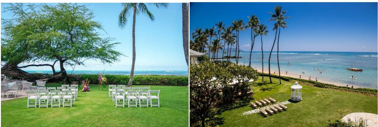
各ホテルのガーデン挙式会場 / 左)「ハレクラニ」 右)「ザ・カハラ・ホテル&リゾート」

当社は今後も、リゾート婚の選択肢を広げて需要を掘り起こす考えです。結婚式のスタイルが多様化するなか、様々な婚礼プランを揃え提案力を高めることで、カップルのニーズに応えます。